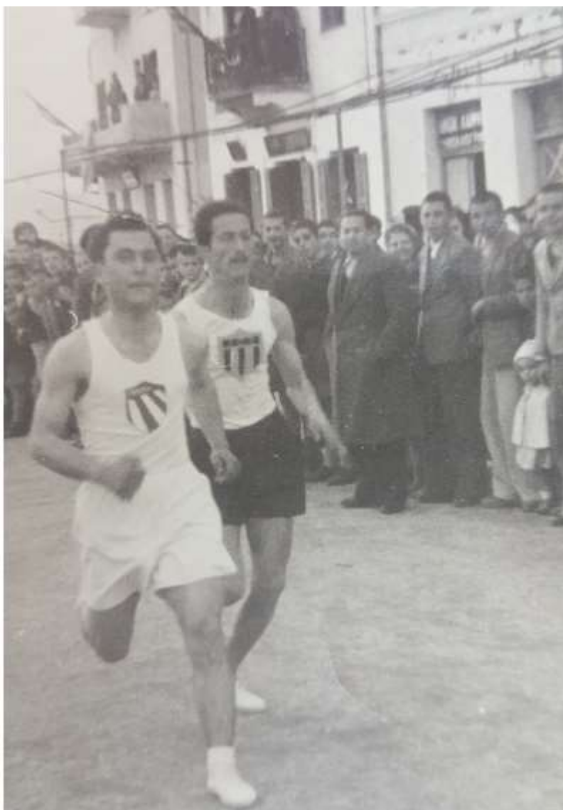
1950 συμμετοχή σε αγώνα δρόμου

= Ο ψυχικός κόσμος του καθενός, δε βρίσκεται εντός του αλλά εκτός αυτού.